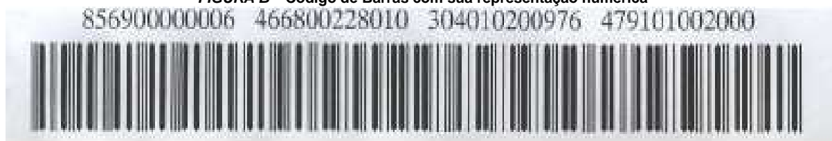
FIGURA B – Código de Barras com sua representação numérica

Este padrão de código de barras possui um dígito verificador geral , e um dígito verificador para cada grupo de 11 posições numéricas.