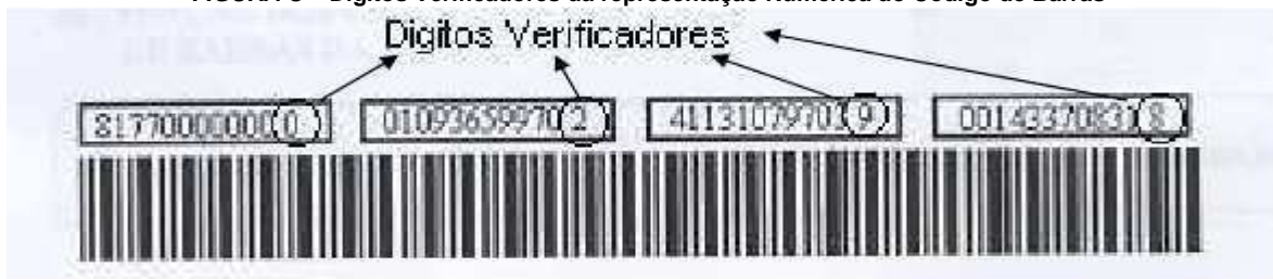
FIGURA C – Dígitos Verificadores da representação Numérica do Código de Barras