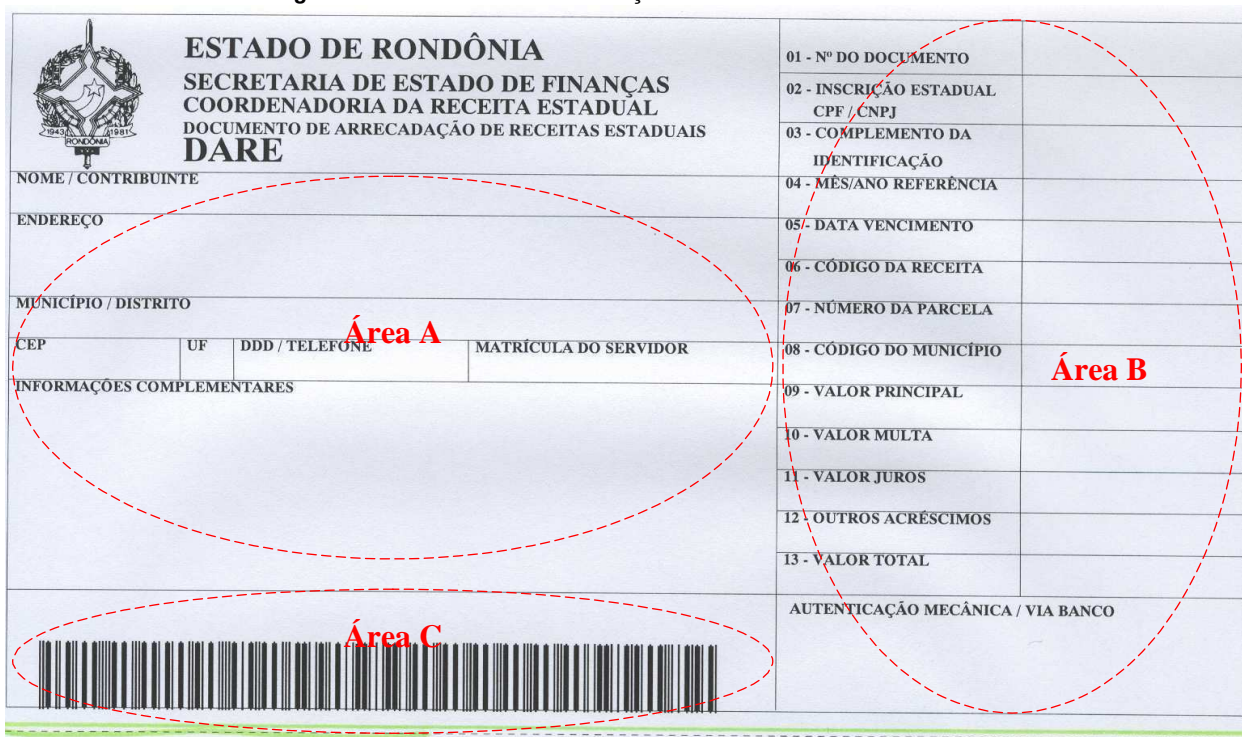
Figura A – Documento de Arrecadação de Receitas Estaduais – DARE