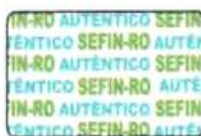
Fundo invisível reagente a luz UV, as palavras "AUTÉNTICO" e "SEFIN/RO" na cor verde